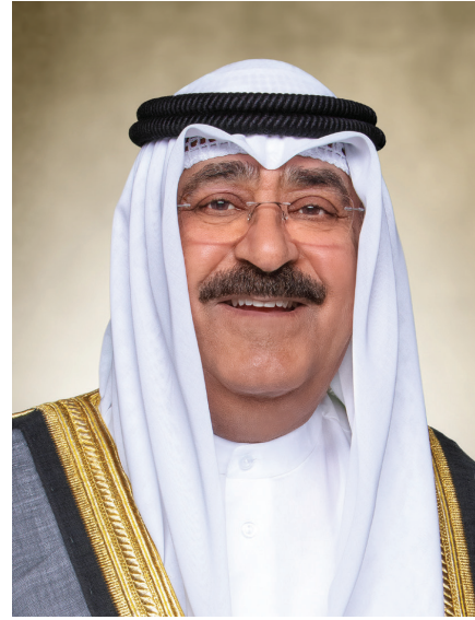
سمو الشيخ مشعل الأحمد الجابر الصباح أمير دولة الكويت