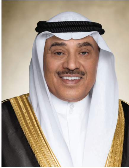
سمو الشيخ صباح خالد الحمد الصباح ولي عهد دولة الكويت